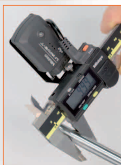
Передатчик U-WAVE-T с универсальным крепежом и соединительным кабелем